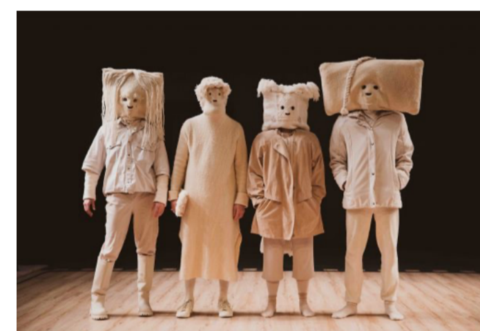
OLD MASTERS : FAIRE MAISON COMMUNE AVEC L'IMAGINAIRE