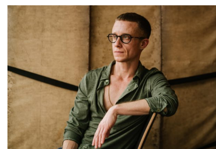
POL PI : DIALOGUER AVEC DORE HOYER

Vu à l'ADC Genève.