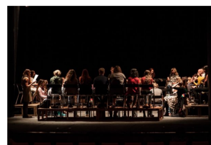
WE ARE STILL WATCHING : LE THÉÂTRE ENTRE LES MAINS DU PUBLIC