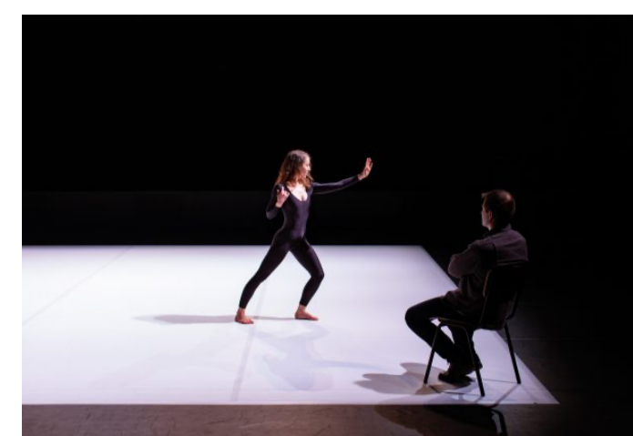
DE BEYONCÉ À MAYA DEREN : LA SCÈNE COMME MACHINE À RÊVER